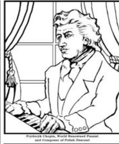
Sample of an illustrative line drawing made for coloring contest

Am 14. Oktober öffnet der Projektraum "The Wand" in der Paulstr. 34, Alt-Moabit, von 14:00 - 18:00 Uhr seine Türen für "Things Take Time", eine Ausstellung mit Kindermalwettbewerb. Gezeigt werden Fotografien und Texte der Politik- und Umweltjournalisten Anna-Katarina Gravggaard und William Wheeler. In Hinblick auf ihre journalistische Arbeit wollen Gravggaard und Wheeler mit ihren Fotografien die Zeit nach Gaddafi in Lybien dokumentieren, den Trinkwasserzugang in Indien, wie auch die Missstände im Bergbau in Kolumbien und den daraus resultierenden Kämpfen um den finanziellen Gewinn. Außerdem beinhaltet die Ausstellung Haitis Wiederaufbau nach dem letzten großen Erdbeben oder, wie Wheeler auf seiner Pulitzer Center Webseite hervorhebt: "nach der schlimmsten urbanen Katastrophe in der modernen Geschichte". Das Projekt bildet eine Mischung aus wissenschaftlich recherchiertem Hintergrundwissen und einer Rezension zu den neu agierenden Global Players.